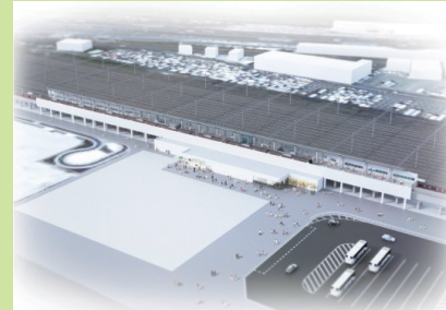
新駅のイメージパース (2017年度基本調査より) Prospective image of the new train station (from the 2017 Fiscal Year basic inspection)