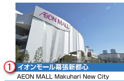
1 イオンモール幕張新都心 AEON MALL Makuhari New City

This expansion area, composed of the Toyosuna District (Chiba City) and the Shibazono District (Narashino City), complements Makuhari New City and drives development. Currently, introduction of large commercial facilities is connecting and unifying the Makuhari New City central zone with the Shin-Narashino area, improving accessibility, and creating new appeal.