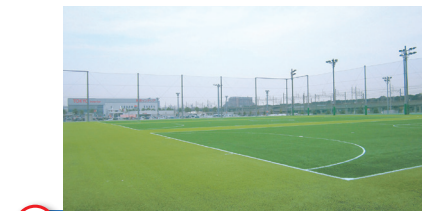
8 芝園公園 Shibazono Park