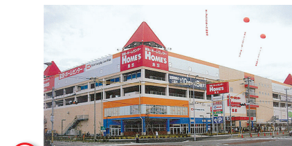
7 島忠ホームズ幕張店 Shimachu HOME's Makuhari