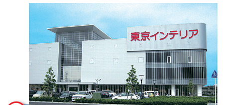
11 東京インテリア家具幕張店 Tokyo Interior Makuhari store