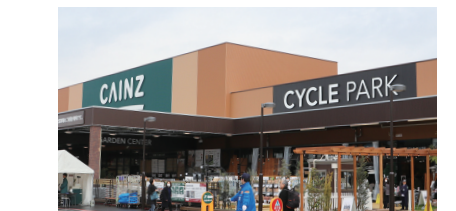
10 カインズ幕張 CAINZ Makuhari