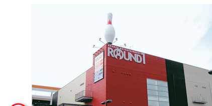
6 ラウンドワン習志野店 Round1 Narashino