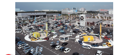
9 WOW! TOWN 幕張 WOW! TOWN Makuhari