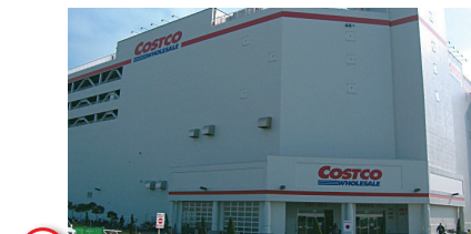
4 コストコホールセールジャパン幕張倉庫店 Costco Wholesale Japan Makuhari