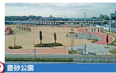
2 豊砂公園 Toyosuna Park