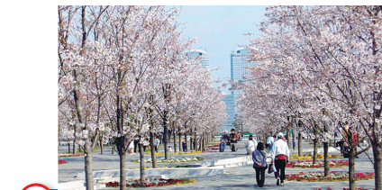
5 パナソニック(さくら広場) SAKURA HIROBA