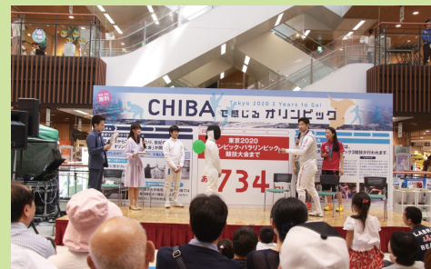
東京2020オリンピック競技大会の2年前記念イベントの様子 Event celebrating 2 years until the Tokyo 2020